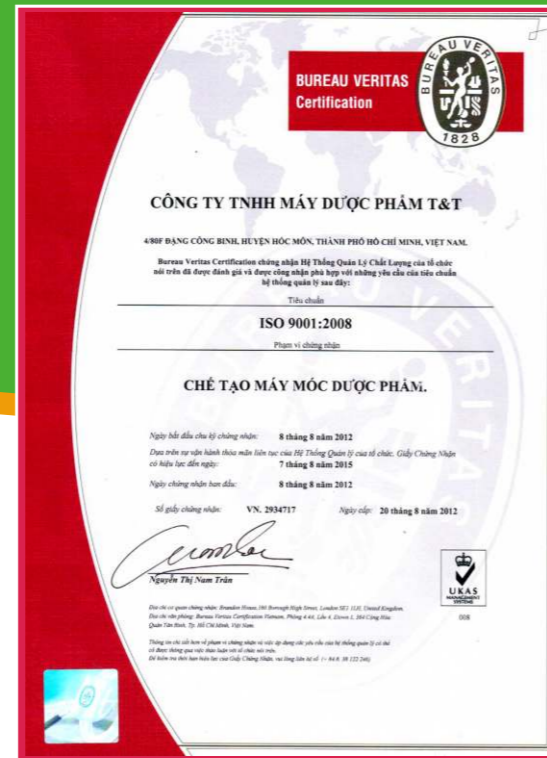
Giấy Chứng Nhận ISO 9001:2008